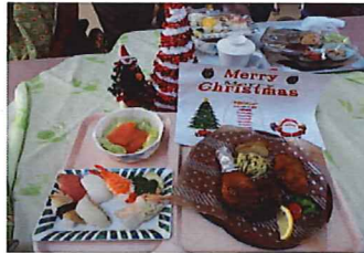
▲食べきれない程のごちそうが並びます