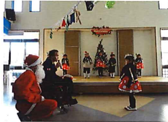
▲かわいらしい歌とダンスを披露してくれました!