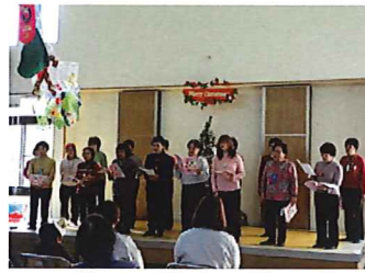
▲美しい歌声に思わずうっとり…♥

十二月十九日、クリスマス会が行われました。今年も、認定こども園ひまわり保育園の園児さんと「小林女声コーラス」の方々が来園され、歌や踊りの発表をして頂きました。発表の最後にはアンコールが沸き起こり、小林女声コーラスの皆さんとひまわり保育園の園児さん、そして利用者の皆さんで「大きな栗の木の下で」を歌い、会場は一体感に包まれました。 また、全体会食ではローストチキンやまり寿司、ハンバーグなど食べきれないほどのごちそうが振舞われました。食後にはクリスマスケーキとコーヒーがサンタさんから配られ、大変楽しい会食となりました。