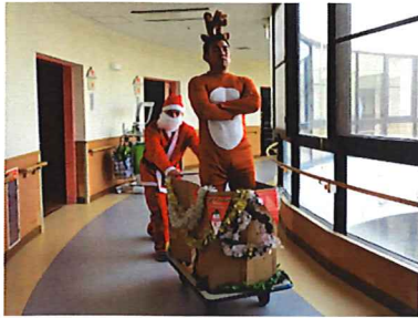
▲トナカイさんがぞりに乗ってプレゼントを届けます!?

十二月十九日、クリスマス会が行われました。今年も、認定こども園ひまわり保育園の園児さんと「小林女声コーラス」の方々が来園され、歌や踊りの発表をして頂きました。発表の最後にはアンコールが沸き起こり、小林女声コーラスの皆さんとひまわり保育園の園児さん、そして利用者の皆さんで「大きな栗の木の下で」を歌い、会場は一体感に包まれました。 また、全体会食ではローストチキンやまり寿司、ハンバーグなど食べきれないほどのごちそうが振舞われました。食後にはクリスマスケーキとコーヒーがサンタさんから配られ、大変楽しい会食となりました。